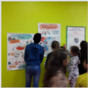
Sensibilisation au gaspillage alimentaire et au « bien mangé » au péricolaire Jean Zay