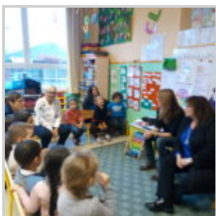
Atelier sur le réemploi à l'École maternelle des Quatre Saisons