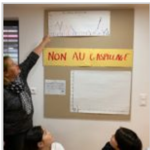
Action de réduction du gaspillage alimentaire au périscolaire de Wittenheim