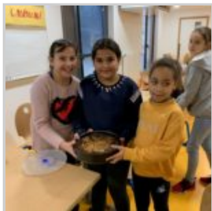
Action de réduction du gaspillage alimentaire au périscolaire de Wittenheim