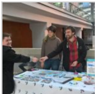
Mise en place d'un stand de Transition Ecologique à la faculté Fonderie de Mulhouse