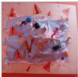
Atelier bricolage pour les enfants du CSC Wagner