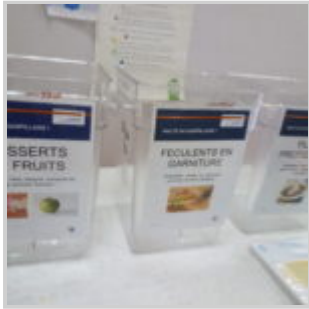
Sensibilisation au gaspillage alimentaire à la cantine Jeanne d'Arc