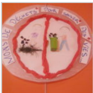
Atelier bricolage pour les enfants du CSC Wagner