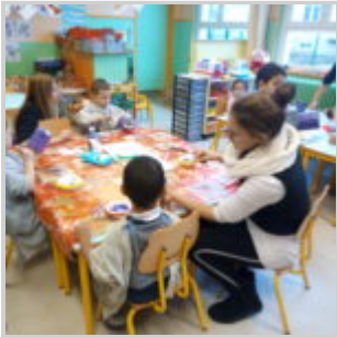
Atelier sur le réemploi à l'École maternelle des Quatre Saisons