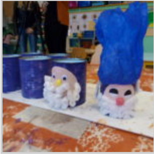
Atelier sur le réemploi à l'École maternelle des Quatre Saisons