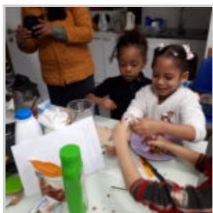
Atelier cuisine « Gestes anti-gaspi » à l'Epicerie des collines