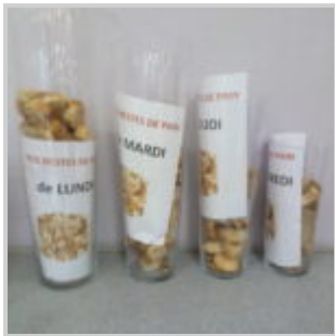
Sensibilisation au gaspillage alimentaire à la cantine Jeanne d'Arc